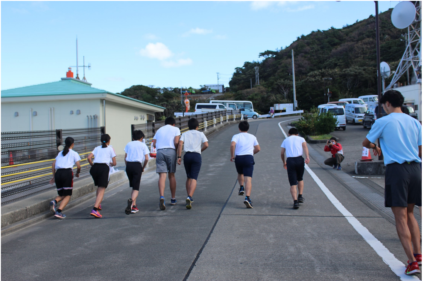
御蔵島小中学校 マラソン練習